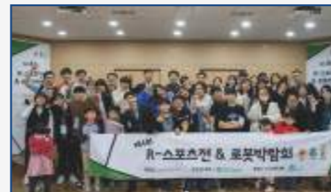
청음복지관 로봇대회 후원(연 1회)