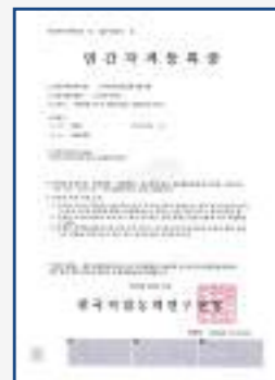
2020년 전문기술투자자 자격 신설