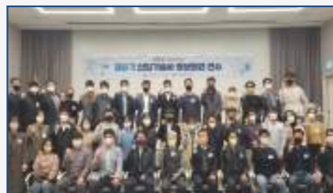
신입기술사 평생회원 연수(연 1회)