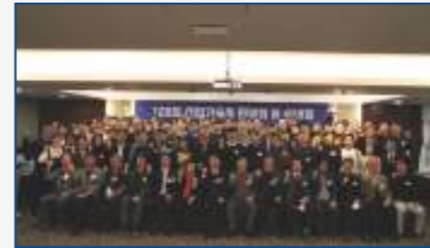
신입기술사 환영회(연 2회)