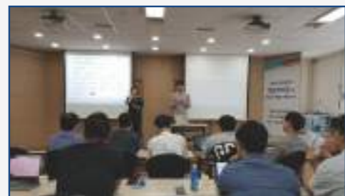
청음복지관 강의(공헌위원회) 매월2회 진행 중