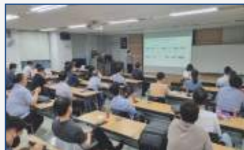
학습모듈 사업 연속 수주(16년~22년)